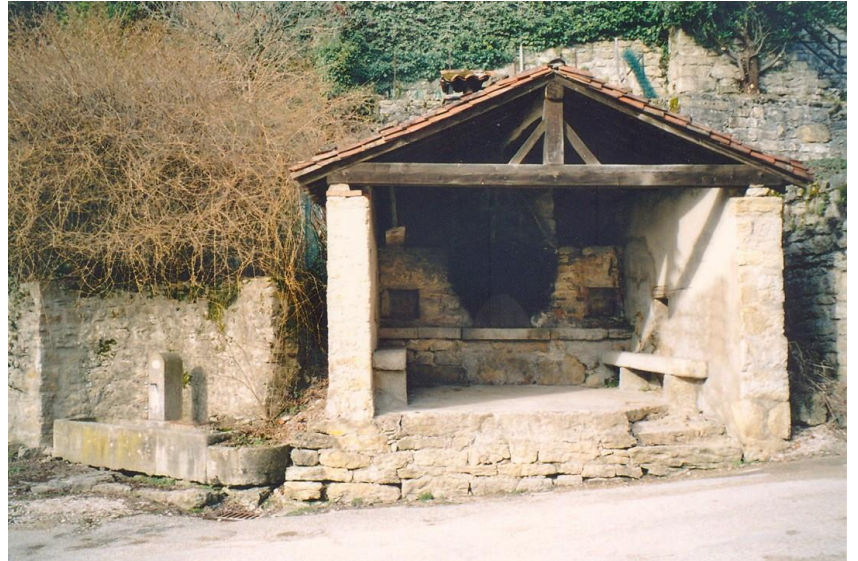
Le four de Chez Chabois

Le four de Dalivoy figure sur le cadastre napoléonien, ce qui situe sa construction avant 1828. Ce four était à deux pans comme le four de Chez Chabois. La Turne (pièce attenante au four) fut construite vers 1911 pour y placer la pompe incendie préalablement entreposée dans le clocher de la mairie. Le projet de sa construction fut évoqué lors de la séance du conseil municipal du 13 août 1911. Pour cela la toiture du four est refaite et le mur nord réhaussé afin d'obtenir un bâtiment à deux pans couvrant le four et la turne.