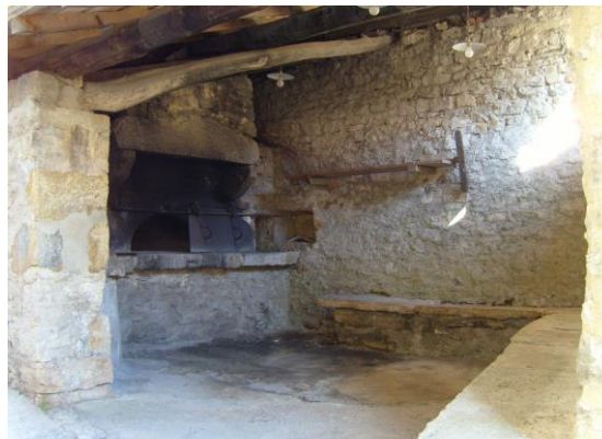
Intérieur du four (toujours utilisé de nos jours !)

Suivant l'acte notarial du 28 avril 1861, M. Louis Fournier fait donation aux habitants du quartier, d'un terrain, lieudit « au Verger », vers la fontaine pour construire un four nouveau avec les matériaux de l'ancien. Il est convenu que « les donataires contribueront par égale part aux charges de construction entretiens et réparations du four ; celui ou ceux qui s'y refuseront seront dès lors déchus du bénéfice de la donation sans indemnité ; l'impôt foncier sera payé par les donataires. »