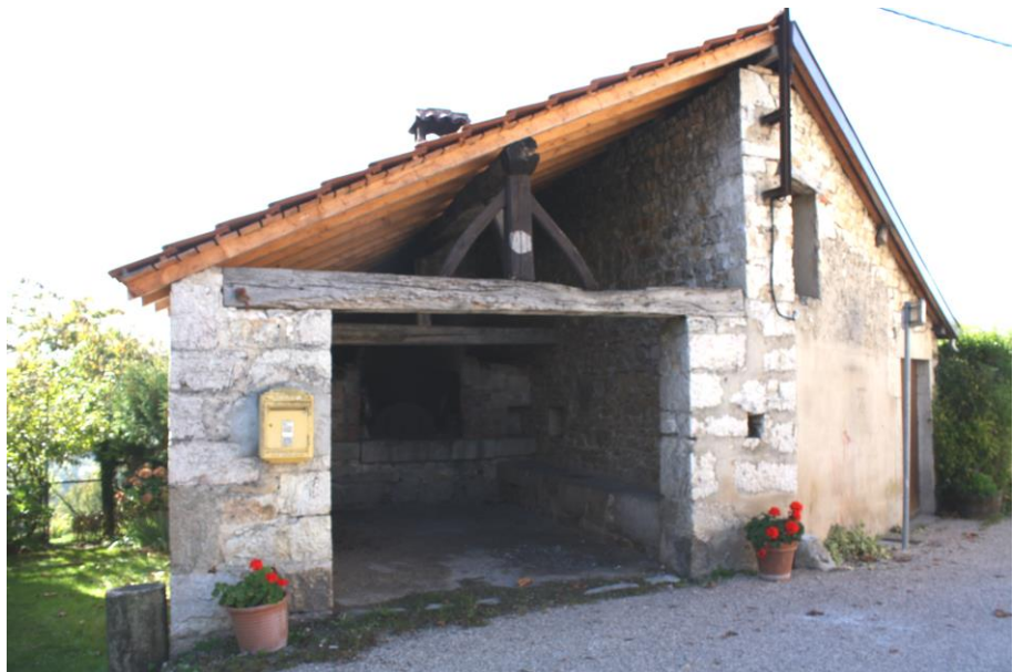
Le four de Dalivoy et la turne

Le four de Dalivoy figure sur le cadastre napoléonien, ce qui situe sa construction avant 1828. Ce four était à deux pans comme le four de Chez Chabois. La Turne (pièce attenante au four) fut construite vers 1911 pour y placer la pompe incendie préalablement entreposée dans le clocher de la mairie. Le projet de sa construction fut évoqué lors de la séance du conseil municipal du 13 août 1911. Pour cela la toiture du four est refaite et le mur nord réhaussé afin d'obtenir un bâtiment à deux pans couvrant le four et la turne.