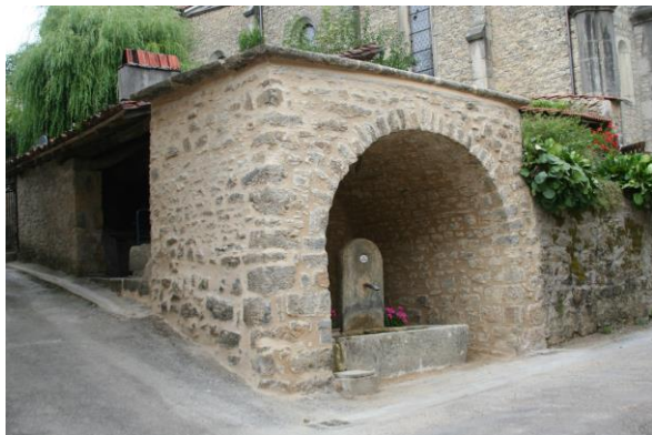
Entrée latérale du « four du verger »

Le four du village appelé aussi « four du verger » a été déplacé en 1861 pour cause d'utilité publique à cause de la construction de la nouvelle église et a été reconstruit derrière la fontaine du village. Le four se trouvait auparavant à l'emplacement des marches de l'église.