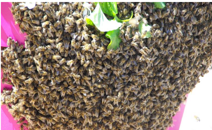
Un essaim posé sur un des pots de fleurs place de la mairie est rapidement récupéré par un apiculteur.